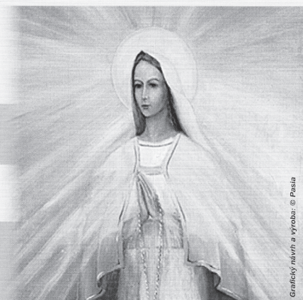
Grafický návrh a výroba: © Pasia